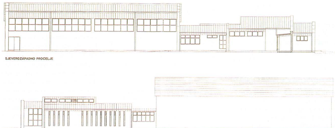
Buduća pročelja školske športske dvorane u Lovasu

gama iz Trakošćana, izvoditelj će biti Gradnja iz Osijeka, a radove će nadzirati Ivanušić projekt iz Vinkovaca (5 milijuna kuna). Projekti za ostale školske zgrade uglavnom su izrađeni.