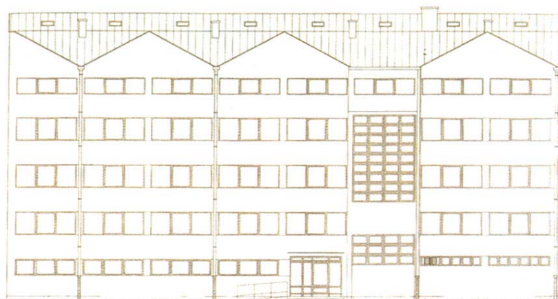
Pročelje trgovačke škole u Osijeku

(vrijednost gotovo 4 milijuna kuna), gdje je projekt izradio MHM iz Osijeka, izvoditelj Zuber iz Višnjevca, a radove nadzire Projekt studio iz Slavanskog Broda. Istodobno se obnavlja i Dom učenika te škole,