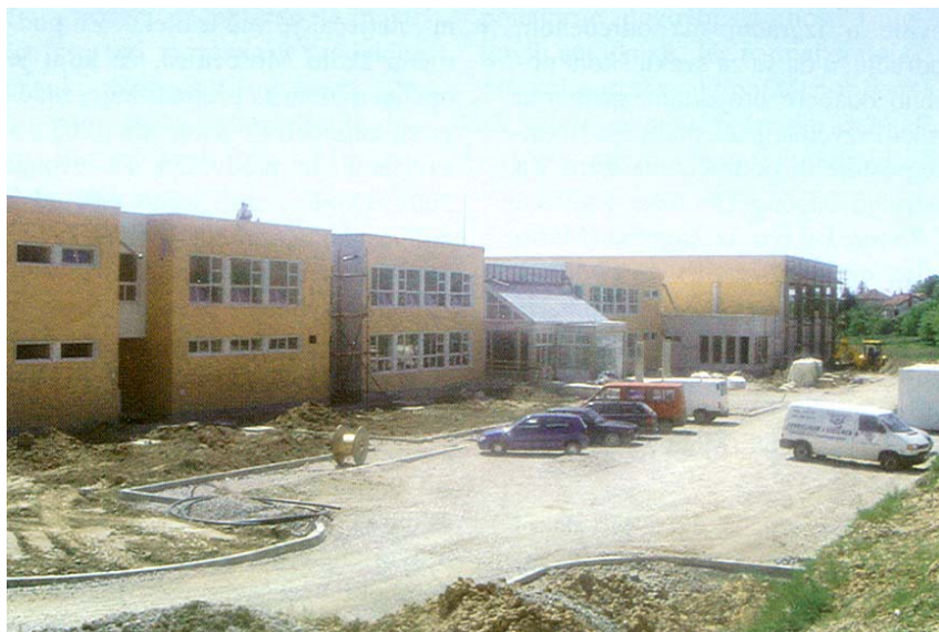
Pogled na gradilište škole i dvorane u Daruvaru

Za sanaciju i gradnju škola i športskih dvorana na području Brodsko-posavske županije utrošit će se više od 106 milijuna kuna. Radi se o 14 škola. Radovi su pred završetkom na gradnji športske dvorane Osnovne škole u Cerniku, gdje radove izvodi Grading iz Cernika, nadzor obavlja Alfa inženjering iz Slavonskog Broda, a općina je ugovorila izradu projekta. Radovi stoje gotovo 7 milijuna kuna. Radovi će biti na vrijeme završeni i na športskoj dvorani područne škole u Vranovcima (rok za dovršetak je 20. lipnja 2006.). Izvoditelj je Projektgradnja iz Slavonskog Broda. Projekt je izradio As iz Zagreba, a radove nadzire Zid iz Slavonskog Broda. Počela je obnova osnovne škole u Starom Petrovom Selu (izvoditelj je Projektgradnja iz Slavonskog Broda) i područne škole Slobodnica (izvoditelj Našički inte-